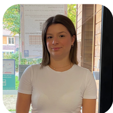
ASSISTANTE DE DIRECTION