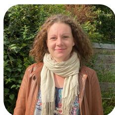
ACJC & INITÉRAIRE BIS

ALSH, CLAS, FAMILLES, «AU COEUR DU QUARTIER»,..