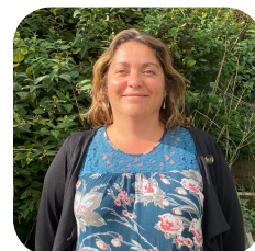
ASSISTANTE DE DIRECTION COMPTABLE