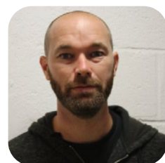
ÉCOLE DE FOOT